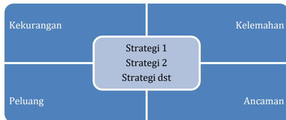
Gambar 6. Rasional penetapan strategi Kriteria ...